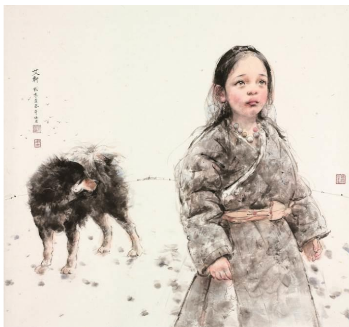
艾軒 《遠方的雲》 2013 年作 彩墨 紙本 90 x 97 公分 估價 HK$ 200,000 - 300,000 / US$ 25,800 - 38,700*

以「重拾 視覺藝術的美感價值」為題 「寫神」·「結構」·「舒韻」 三部分展示現當代藝術的創作精髓 另特別呈獻張大千高雅之作《桐蔭逸士》