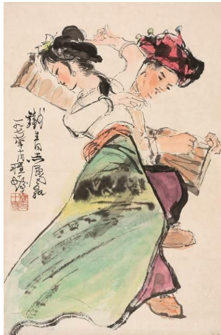
程十髮《傣族長鼓舞》