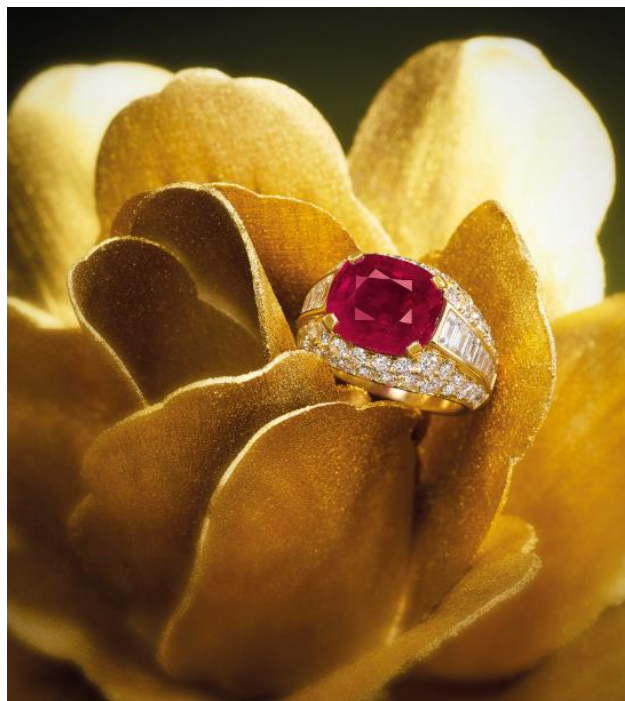
8.06 克拉天然缅甸抹谷未经加热处理「鸽血红」红宝石配钻石戒指，Bulgari 出品

估价：HK$ 3,500,000 – 4,500,000 / US$ 450,000 – 577,000